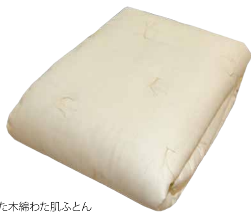
無農薬で作られた木綿わた肌ふとん シングル13,500円

天然素材100%ですので生分解性があり、最後は土に還ります。打直しもできますので、資源を再利用することで長く使うことができます。