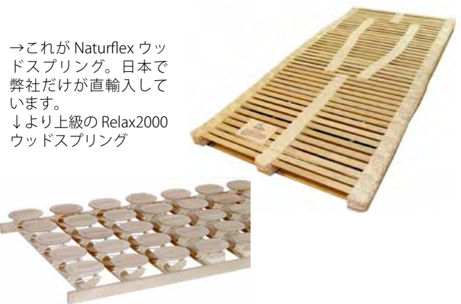
→これが Naturflex ウッドスプリング。日本で弊社だけが直輸入しています。 ↓より上級の Relax2000 ウッドスプリング