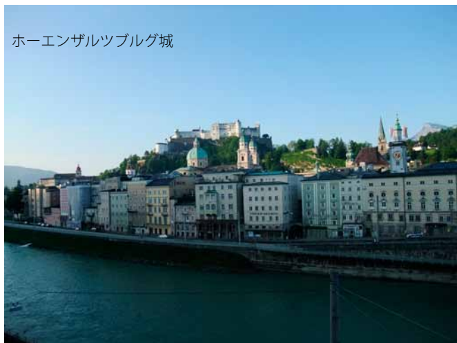
ホーエンザルツブルグ城